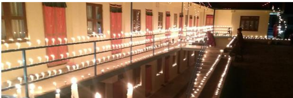
Figuur 7 Thupten Hoezerling Nunnery, Hyolmo, Helambu, Nepal