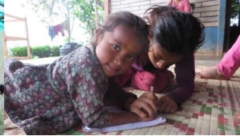
Figuur 6 Onderwijs