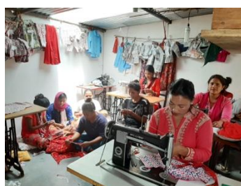
Figuur 2 Naaiatelier in Pumbdi