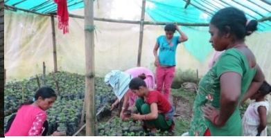
Figuur 5 Tuinieren