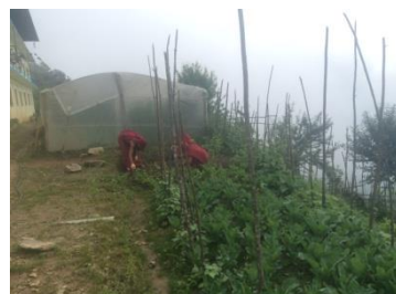
Figuur 3 De biologische groentetuin met zelfgemaakte kas