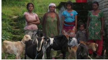
Figuur 4 Biologische boerderij

Om deze doelstellingen te kunnen behalen houdt de stichting zich het recht voor actief op zoek te gaan naar sponsoren en geldschieters, middels de middelen die haar ter beschikking staan.