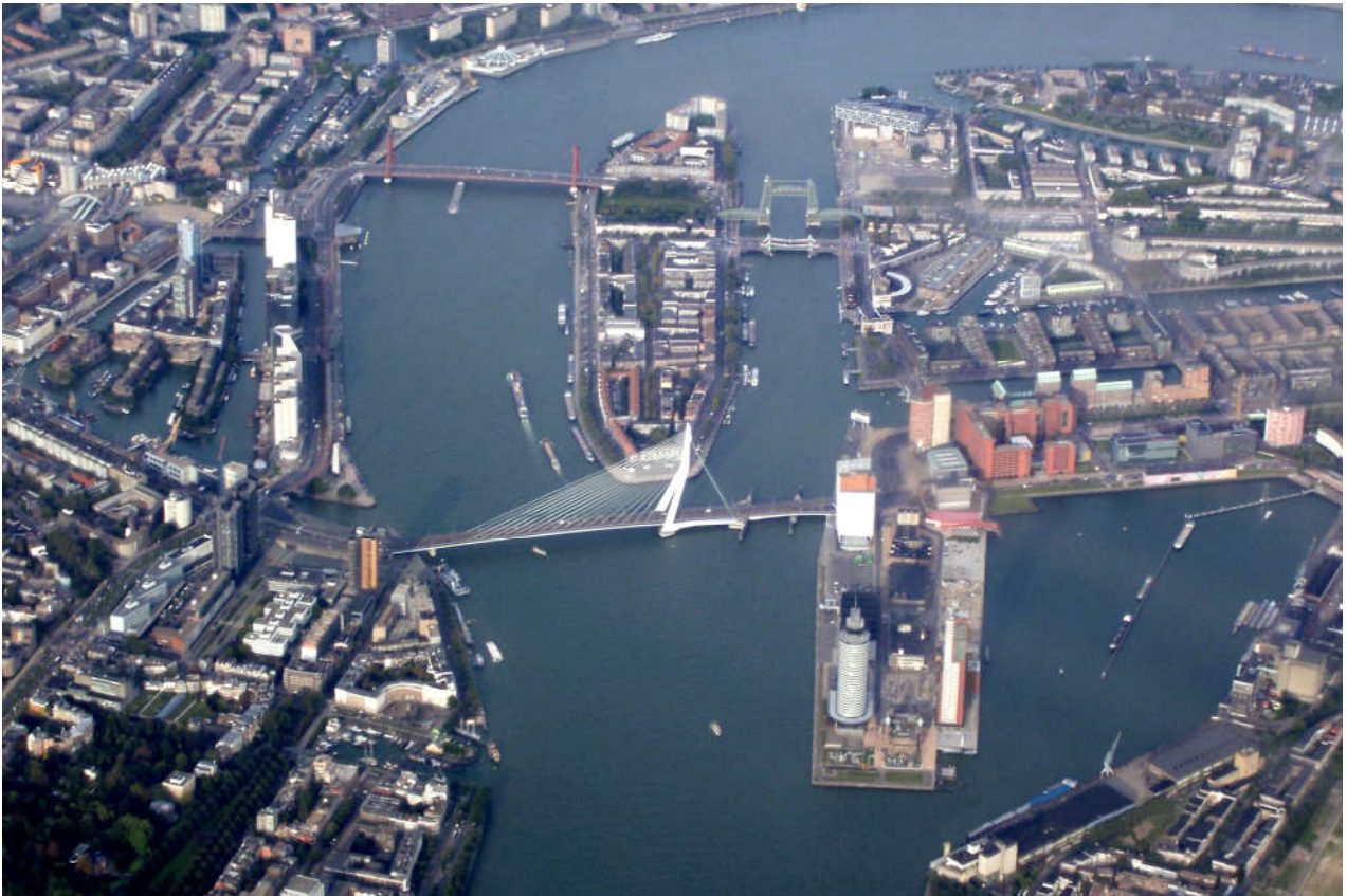
Nieuwe Maas en Koningshaven, luchtfoto 28-09-2005.

↓ De Hef, Koningshavenbrug ↓ Koninginnebrug (vóór De Hef)