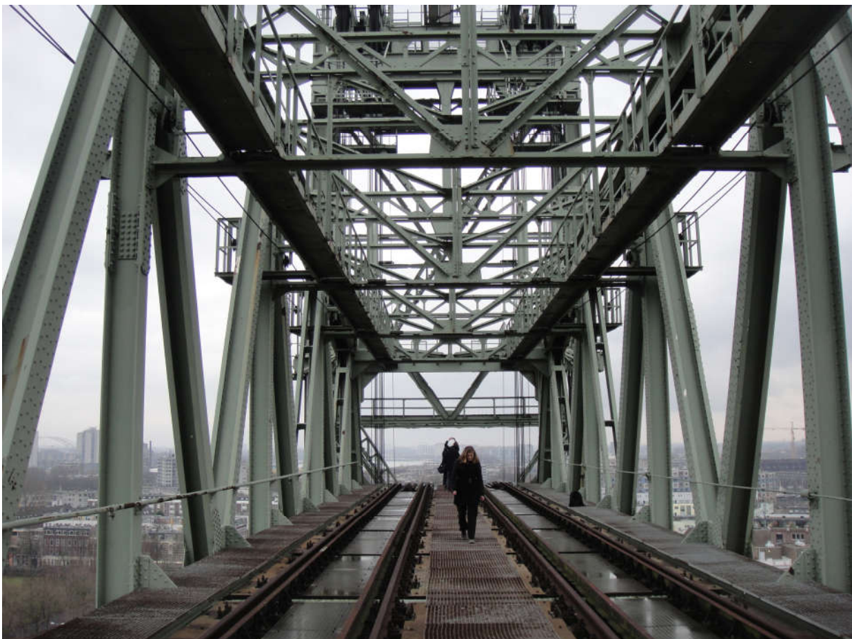
Met De Hef omhoog

De subsidie van het Stadsinitiatief 2014 kan sinds 2021 alsnog worden toegekend aan het plan voor De Hef. Het team uit 2014 gaat na de zomer van 2021 opnieuw aan de slag om van De Hef een culturele Rotterdamse attractie te maken.